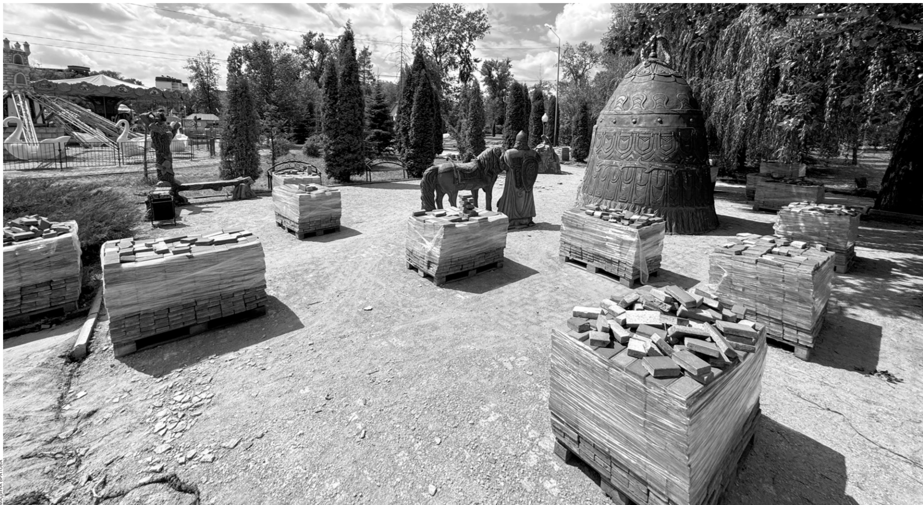
В парке культуры и отдыха «Зеленый остров» уже демонтировали старую тротуарную плитку

Подрядчиком выступила организация ООО «СтройГрад», которая уже не первый год сотрудничает с администрацией Черкесска. На ее счету целый ряд сложных, но успешно реализованных проектов. Например,