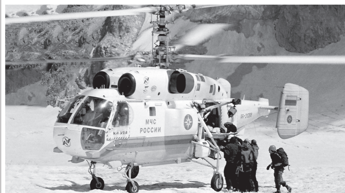
В любое время дня и ночи спасатели спешат на помощь пострадавшим