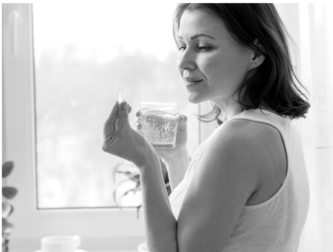
При приеме антибиотиков необходимо корректировать свое питание

В программу лечения антибиотиками часто включают витаминные, прием которых тоже специфичен. Так, поливитамины и антагонисты могут содержать минера-