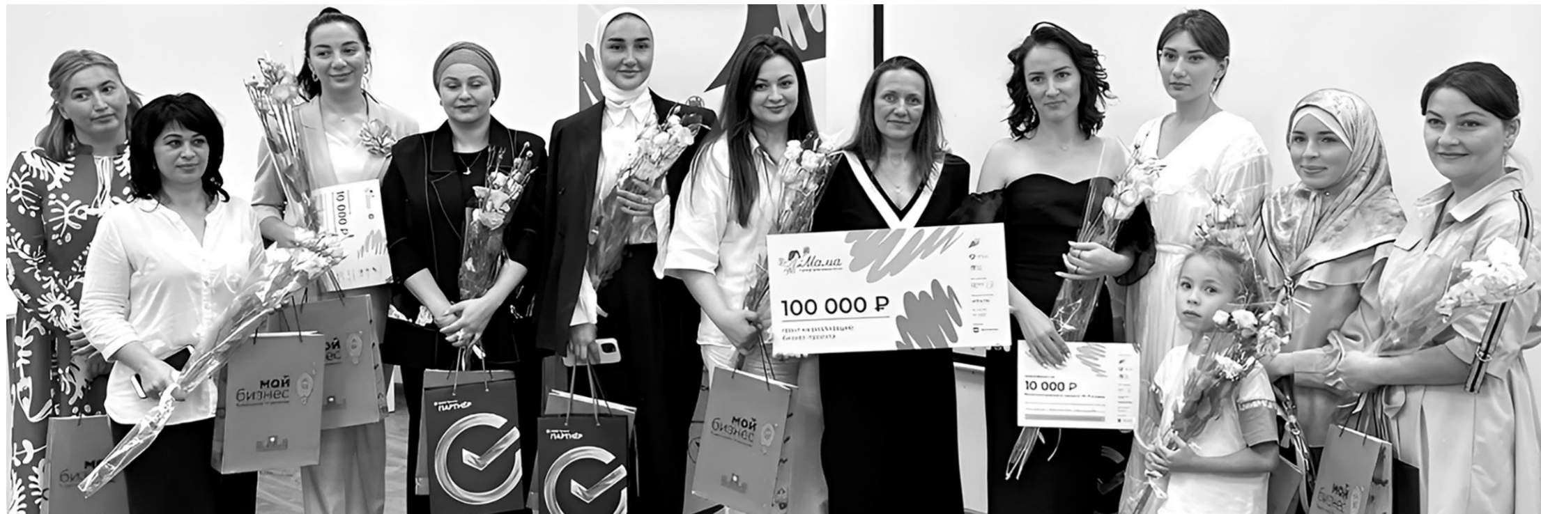
Победители и призеры регионального этапа федеральной программы «Мама-предприниматель»

В Карачаево-Черкесии впервые прошел региональный этап федеральной образовательной программы «Мама-предприниматель»